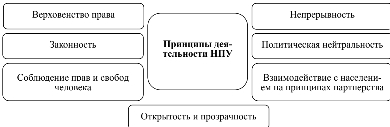
Рисунок 2 — Социальная направленность принципов деятельности НПУ

Социальная направленность правоохранительной деятельности в первую очередь отображена в принципах деятельности НПУ (статьи 6–12 раздела II Закона Украины «О Национальной полиции») [2], которые непосредственно ориентируют правоохранителей на соблюдение прав и свобод граждан (рисунок 2).